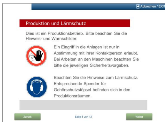
Beispielfolie für die Belehrung (Sicherheitsunterweisung)

Mit dem VISIT.net Modul „Sicherheitsunterweisung“ lassen sich Unterweisungen individuell und themenspezifisch gestalten. Je nachdem, ob sich ein Handwerker, Besucher oder Lieferant am Empfang oder der Pforte meldet, lässt sich eine passende Unterweisung durchführen und mittels Kontrollfragen prüfen.